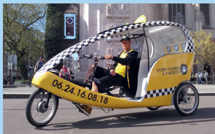
BAYK (marque allemande, taxivélo made in europe) Happymoov'