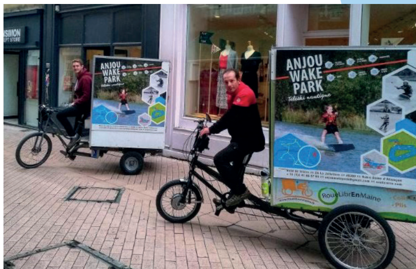
Rouelibrenmaine, livraison en triporteur - Angers

Il est donc important de choisir un secteur géographique avec une bonne densité de clients potentiels.