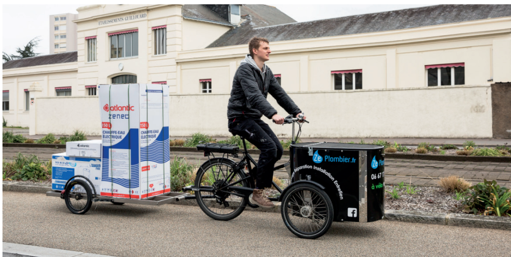
Ze Plombier, plombier - Nantes

Attention aussi à ce que votre vendeur vous informe bien sur le respect des réglementations en vigueur de l'équipement du vélo ou de la puissance moteur. Vous engagez ici votre responsabilité pénale en cas de contournement de la loi.