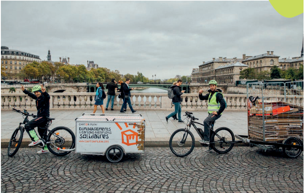
Carton Plein, déménagement et réemploi de cartons - Paris