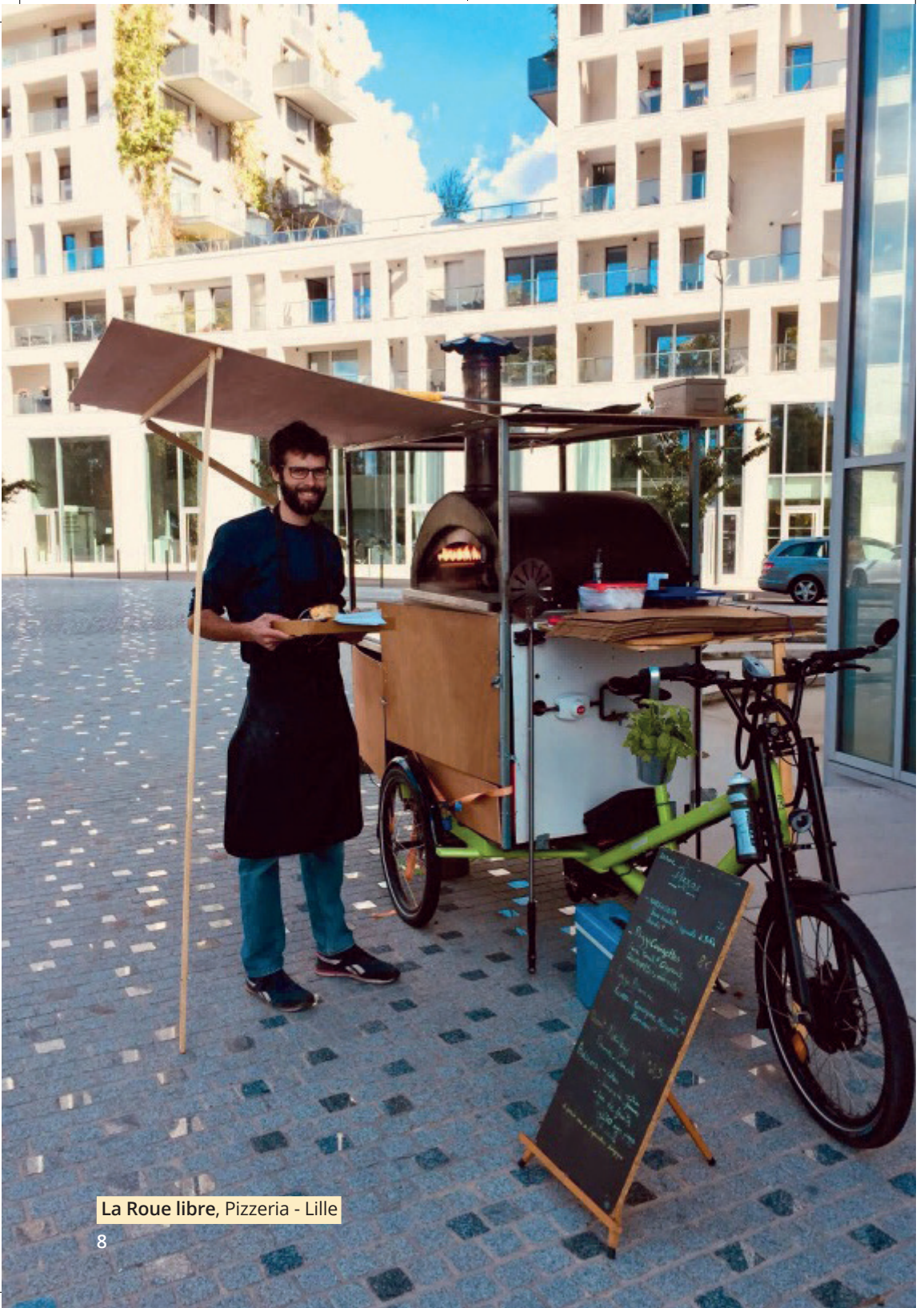
La Roue libre, Pizzeria - Lille