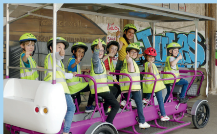
Partenariat avec un fabricant néerlandais - S'cool Bus S'cool Bus - Rouen