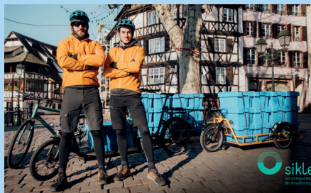
Remorque Carla Cargo, Sikle, collecte de biodéchets - Strasbourg