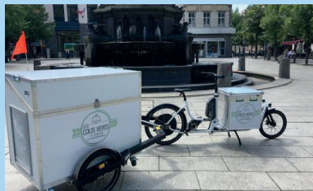
Biporteur et remorque fleximodal Les Colis Verts - Clermont-Ferrand