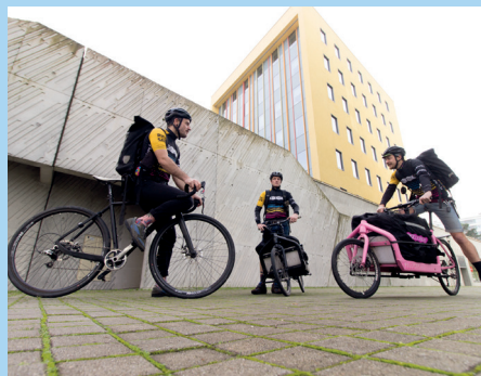
Bullits et vélo de route Bicicouriers - Nantes