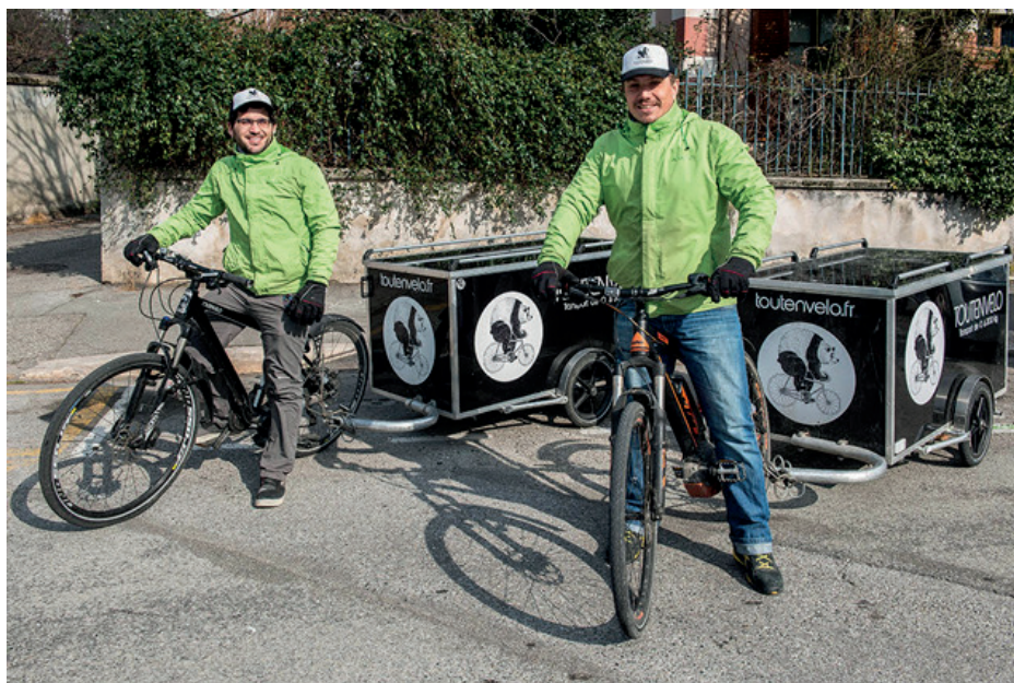
Toutenvélo, Logistique urbaine - Grenoble