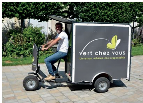
Vert chez vous, livraisons - Lyon

Pour toutes les informations spécifiques à ces sujets, vous pouvez consulter la Chambre des Commerces et de l'Industrie (CCI) et la Chambre des métiers.